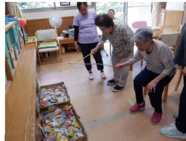
うまく釣れるかな?