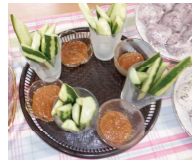
バイキング料理はおいしかったよ。お腹いっぱい食べました!!