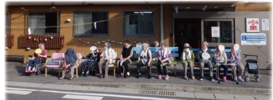
7/23、西日がきつい時間でしたが早くから準備をして玄関前でみこし行列を見物しました。

※個人が特定できる写真の掲載については、承諾いただいている方のみ掲載させていただきます。