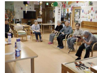
午前中は昼食の準備の手伝いや、懐かしいゲームなどで楽しく過ごしました。