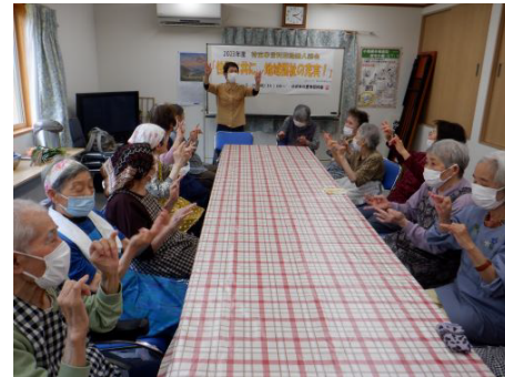
作業前の準備体操も忘れてはいません