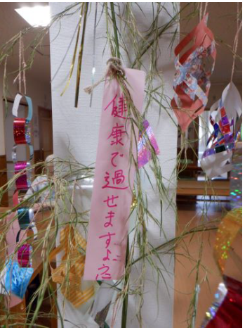
短冊に願いを込めて

小規模多機能では、朴葉寿司を作る機会があり、見た目の鮮やかさと懐かしさも相まって、皆さま夢中で食べ満足されていました。