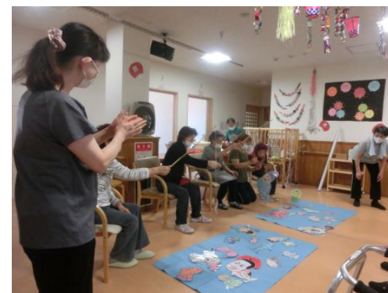
以前の夏祭り風景