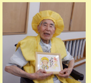
息子さんからのプレゼントを手にハイポーズ