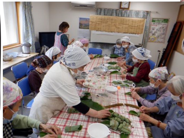
6/20 元気サロン朴葉巻作り