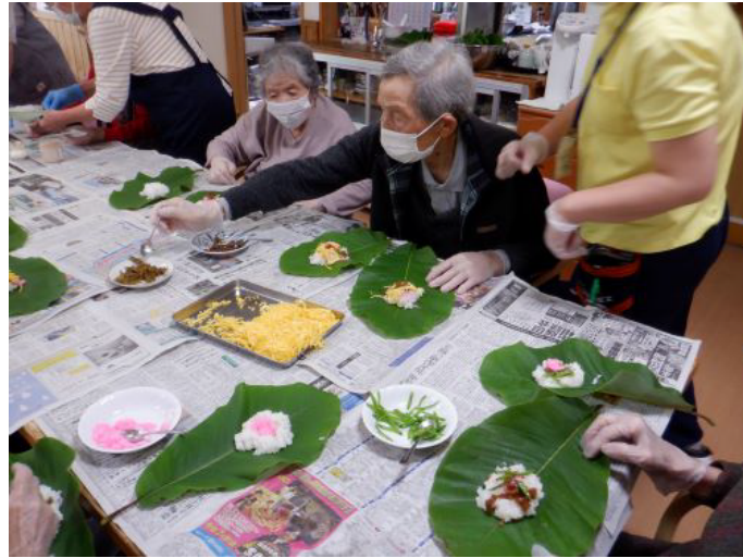
6/16 小規模多機能では、朴葉寿司に初挑戦しました