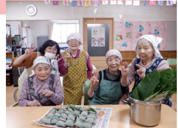
6/14 GH 朴葉巻作り