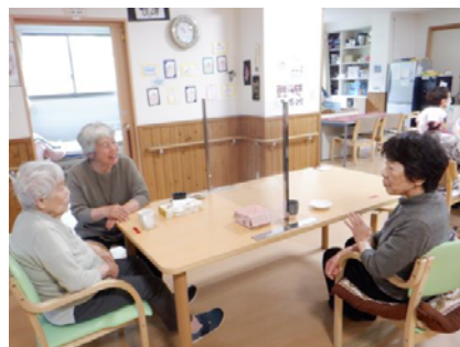
6/23 傾聴ボランティア