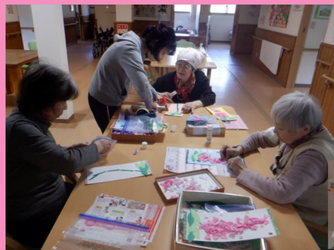
藤の花をイメージして、飾り物を作ってみました。細かい作業でしたが、根気よく取り組んでいました。