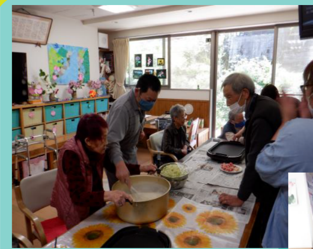
5月誕生日の方ご希望の【お好み焼き】を、皆で作って食べました。3枚近くお代わりする方もいて、味や食べやすさいずれも好評でした。