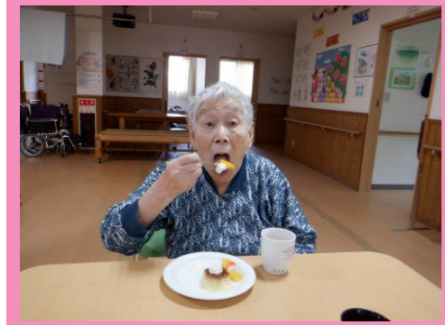
いいとこ撮られちゃった。美味しい物はこんくらいの勢いで食べなくちゃね。