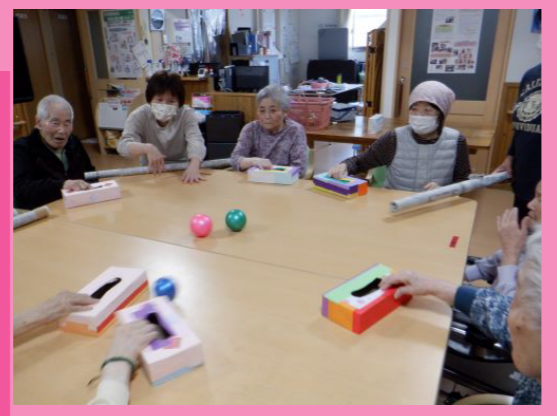
↑テーブルホッケー、結構白熱してるんですよ。 ←80の手習い?かな。いくつになっても挑戦あるのみですね。